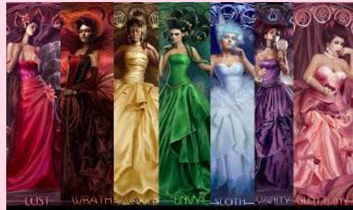
Fotos de mujeres que incitan a pecar 1

¿En qué época estoy? ¿Me habré metido en la máquina del tiempo? No; es la cruda realidad; ideas e imágenes simbólicas que perduran.